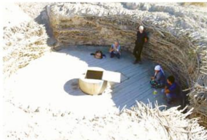
Ернеуі кен, түбіне қарай тарылған, ішкі қабырға шегені сексеуіл, қоршауы жыныс және сексеуіл шыбықтарымен көтерілген құдық. Сырдария, Нұртуған құдығы.

Топырақ жұмсақ, борпылдақ болып, әрі суы таяздан шықса, құдық диаметрі кен алты қанат үйдің көлеміндей етіп алынады да, құдық іші түбіне қарай тарылады. Ернеуін кен етіп алмаса, топырақ ішке жалысып, құмды суықлап, құдық түбін өздігінен көміп тастайды. Мұндай құдықтар аралық еспе құдықтан әлсізмен қазылады. Құдық түбінен су шыққанда, шамамен 1,50-1,70 м. болатындай шиліндер тәрізді ұңғы қазып, қабырғасын сексеуілмен шегендеп отырғызады. Құдық қабырғасындағы топырақ түбіне сусып түспес үшін екі рет белдеулік сексеуіл шеген орнатады. Түбімен қоса алғанда үш дөңгөйлі шеген деуге болады. Ернеуі кен, түбіне қарай тарылған сексеуіл шегендер Сырдың құмдарында кездеседі.