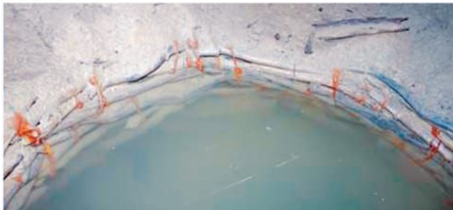
Ақ сексеуіл шегені

Қышты киюластырып қана емес, бірнеше ғасырға қызмет ететіндей күйдіріп, өріп шығару – халықтық білімнің нәтижесі.