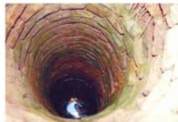
Қазалы қыш құдықтарының қабырға шегені.

Қыш құдықтардың орны ерте ортағасырлық қалалардан табылып жататыны тарихтан белгілі. Яғни қыш құдық қалалық өркеніеттің бір айғағы десек, артық болмас. Құдық қабырғасын өруге дайындалған қыш кесектер арнайы неште қатты күйдіріледі. Қатты күйдірілген қыш суда ерімейді. Қыш құдықтың барлық түрі шиліндер пішімінде қазылып, су көзіне қыш арасынан саңылау шөл қалдырылып өріп отырған. Қыш шеген