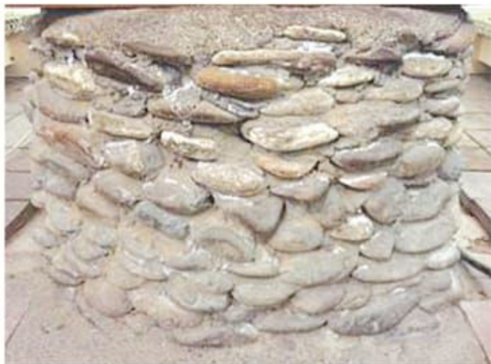
Қожа Ахмет Яссауи кесенесінің қиы құдығының тас ернеуі және ішкі қиы шегені

Дәстүрлі қиы құдықтардың қақпағы ағаштан жасалған. Ағаш құдық ішіндегі таза ауа айналымын қамтамасыз еткен.