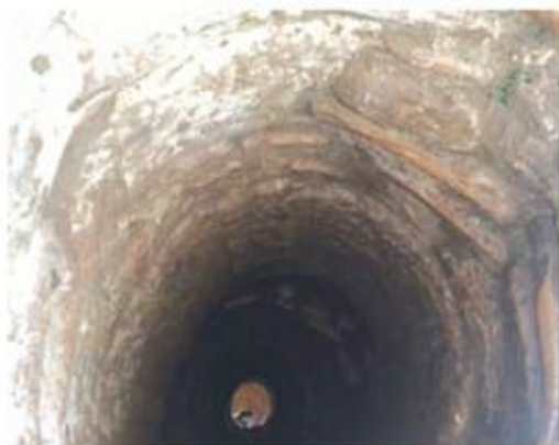
Арыстан Баб құдығының ішкі қиы шегені

Сырдария аңғарындағы цилиндр пішіміндегі қиы шегеннің ерекше, көне әрі терең қаланған үлгісі – Қожа Ахмет Яссауи кесенесі мен Арыстан баб кесенесінің құдығы. Осы кесенелерден бұрын құдық қазылып, құдық суы кесенені көтеруге, сәулетші-құрылысшыларды сумен қамтамасыз етуге қызмет еткен. Қожа Ахмет Яссауи кесенесінің бір құдығы қайта қалпына келтіріліп, бүгінде ол «Құдықхана» деп аталған музей экспозициясын құрайды.