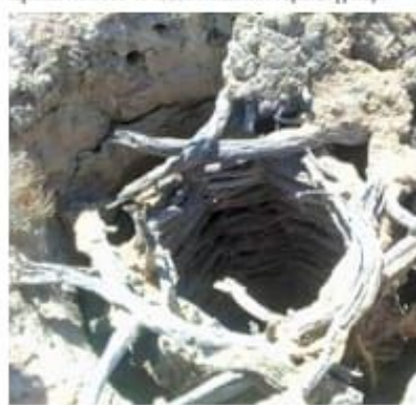
Сегіз қырағы етіп қаланған ақ сексеуіл шегені. Қызылорда, Қармақшы, Қызылқұм.

Қызылқұм мен Бетпақдалада сексеуіл шегендердің дәстүрлі өлшеммен 15-20 құлаш немесе 45 қадамға дейін терең түрлері